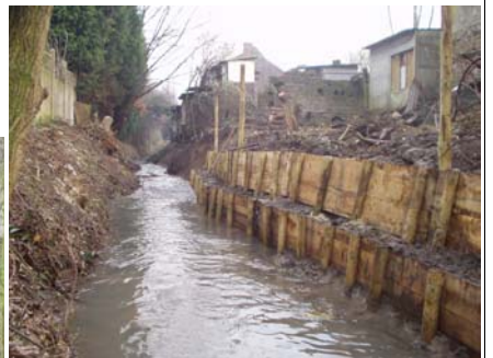
L'équipe de la CAL qui a fait sauter un gros barrage fait de tôles et de débris puis qui a consolidé les berges du « Grand Nocq »

en parler... ainsi les maisons se vendraient mieux. Faut-il être naïf pour imaginer que ce qui s'est passé le 27 août a été oublié ! Faut-il également être mal informé pour ignorer que les problèmes d'inondation doivent maintenant figurer sur les contrats de vente. Si nous voulons oublier les inondations il faut être tous ensemble à vouloir résoudre le problème. L'émotion, la peur des habitants d'Allouagne est dans toute les têtes. Nous réduirons les risques si nous sommes solidaires.