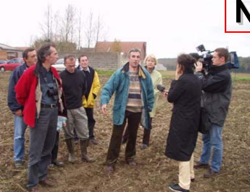
Les membres du bureau qui répondaient aux journalistes de France 3 en octobre dernier

Nous avons devant nous tous les problèmes à régler y compris celui du passage sous l'autoroute, en prenant en compte la situation de nos voisins de Gonnehem. Tant pis pour ceux qui pensent que nous faisons une mauvaise publicité à notre village : nous avons du mal à imaginer que c'est notre combat qui fait venir l'eau dans nos maisons. Nous serons plus forts unis et ensemble, tous ensemble, sinistrés ou non, élus ou simples citoyens.