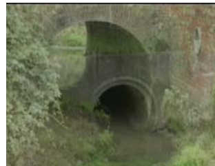
On peut juger de la différence entre la buse de l'autoroute et le pont SNCF sur ce montage photo

Nous avons préféré organiser des réunions de quartier . Cette méthode a permis un réel partage des informations. Nous avons été renseignés ainsi sur tous les problèmes du quartier. Nous avons pu de notre côté montrer deux films. Le premier film met en évidence les problèmes d'arrivée trop rapide de l'eau sur Allouagne, mais