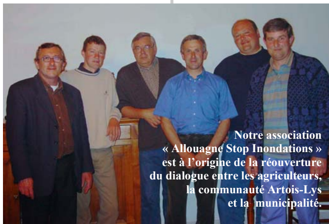
Notre association « Allouagne Stop Inondations » est à l'origine de la réouverture du dialogue entre les agriculteurs, la communauté Artois-Lys et la municipalité.

les. Il faut aussi protéger efficacement les maisons des ruissellements. Nous aurons encore besoin de votre soutien ou parfois de votre collaboration active.