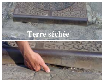
Bouches d'égout totalement bouchées Rues de l'ancien calvaire et Paul Vaillant Couturier